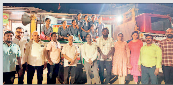
टीबी के खिलाफ लड़ाई जारी

नुककड़ नाटक के जरिए कलाकारों ने समाज में फैली भ्रान्तियों, डर और भेदभाव को बेहद सजीव ढंग से प्रस्तुत किया। नाटक में दिखाया गया कि टीबी से ग्रस्त व्यक्ति को किस तरह सामाजिक उपेक्षा और मानसिक दबाव का सामना करना पड़ता है, जबकि जरूरत इस बात की है कि ऐसे मरीजों को सहानुभूति, सहयोग और सही इलाज मिले। संदेश स्पष्ट था टीबी एक गंभीर लेकिन पूरी तरह से इलाज योग्य बीमारी है, और समय पर उपचार से इसे हराया जा